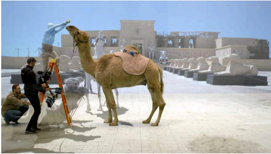
©Andros Zins-Browne and Karthik Pandian, Atlas Revisited , filmstill

Terwijl de alomtegenwoordigheid van telefooncamera's bijgedragen heeft aan de transformatie van elk moment naar een potentieel beeld, zouden we ook kunnen stellen dat één van de doeleinden van politieke structuren, kapitaal en macht in het algemeen, is om technieken te ontwikkelen om alsmaar meer onzichtbaar te worden. Of misschien eerder om er te zijn en er terzelfder tijd niet écht te zijn. De amorfe vormen die macht verdelen, creëren een complex netwerk van relaties die noch echt, noch fictief zijn, maar eerder virtueel.